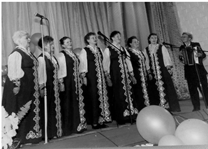
В июле 2023 года коллективу «Сударушка» поселка Басьяновский исполняется 40 лет.